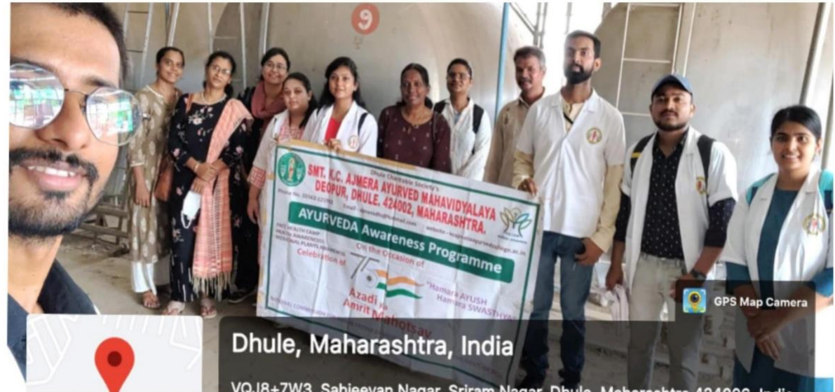
GPS Map Camera