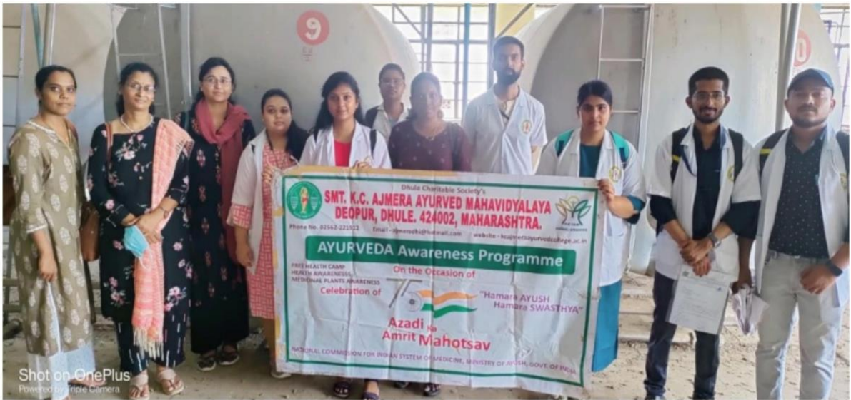
Shot on OnePlus Powered by Triple Camera