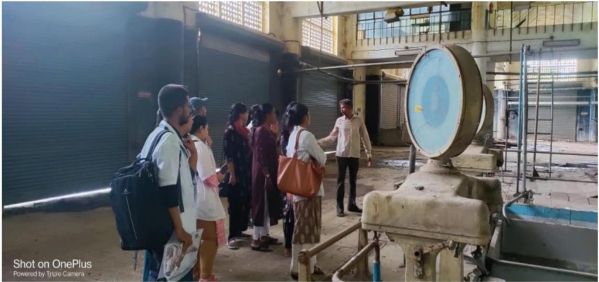
Shot on OnePlus Powered by Triple Camera